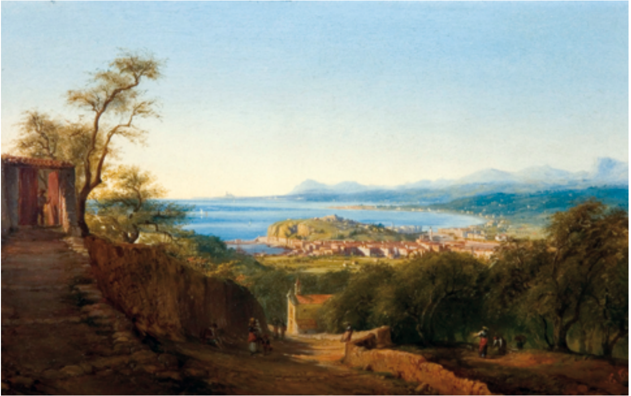
Ercole Trachel, Vue de Nice depuis la Route de Gênes (Grande Corniche) , huile sur panneau, conservée au musée Massena © Musée Masséna / Ville de Nice.