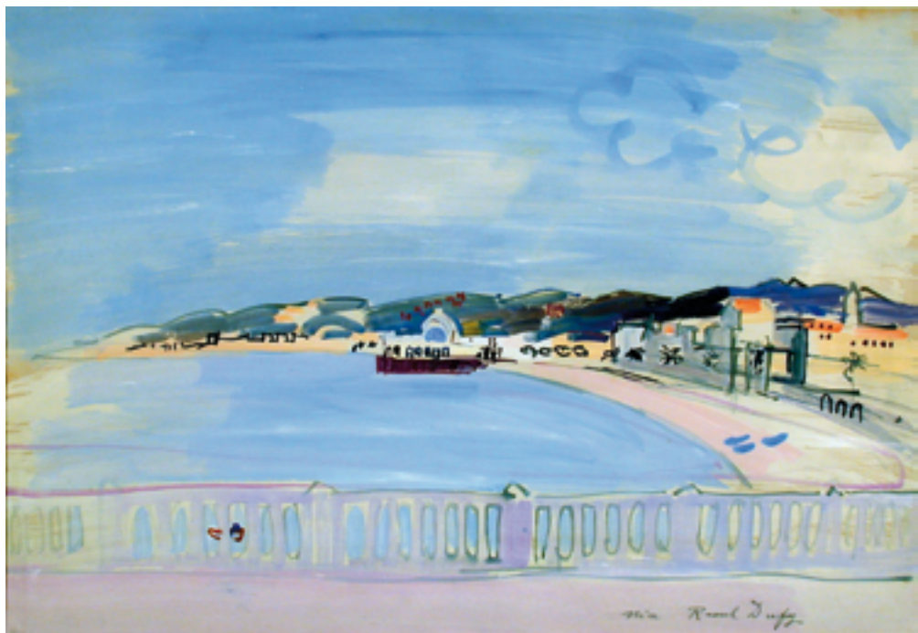
Raoul Dufy, Nice en 1927 (Baie des anges), 1927, aquarelle, dépôt du MNAM au Musée des Beaux-arts de Nice