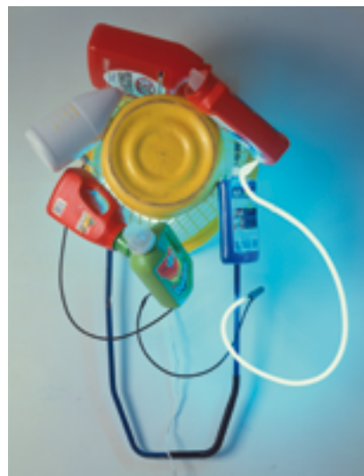
Keith Sonnier, Dis-Play II , 1970, détail (Série « Dis-Play »), mousse en caoutchouc, poudre fluorescente, lumière stroboscopique, lumière noire, néon, verre © ADAGP, Paris 2015. Photo : Courtesy JGM Galerie

Commissaires : Rebecca François, Olivier Bergesi et Laura Pippi-Detrey