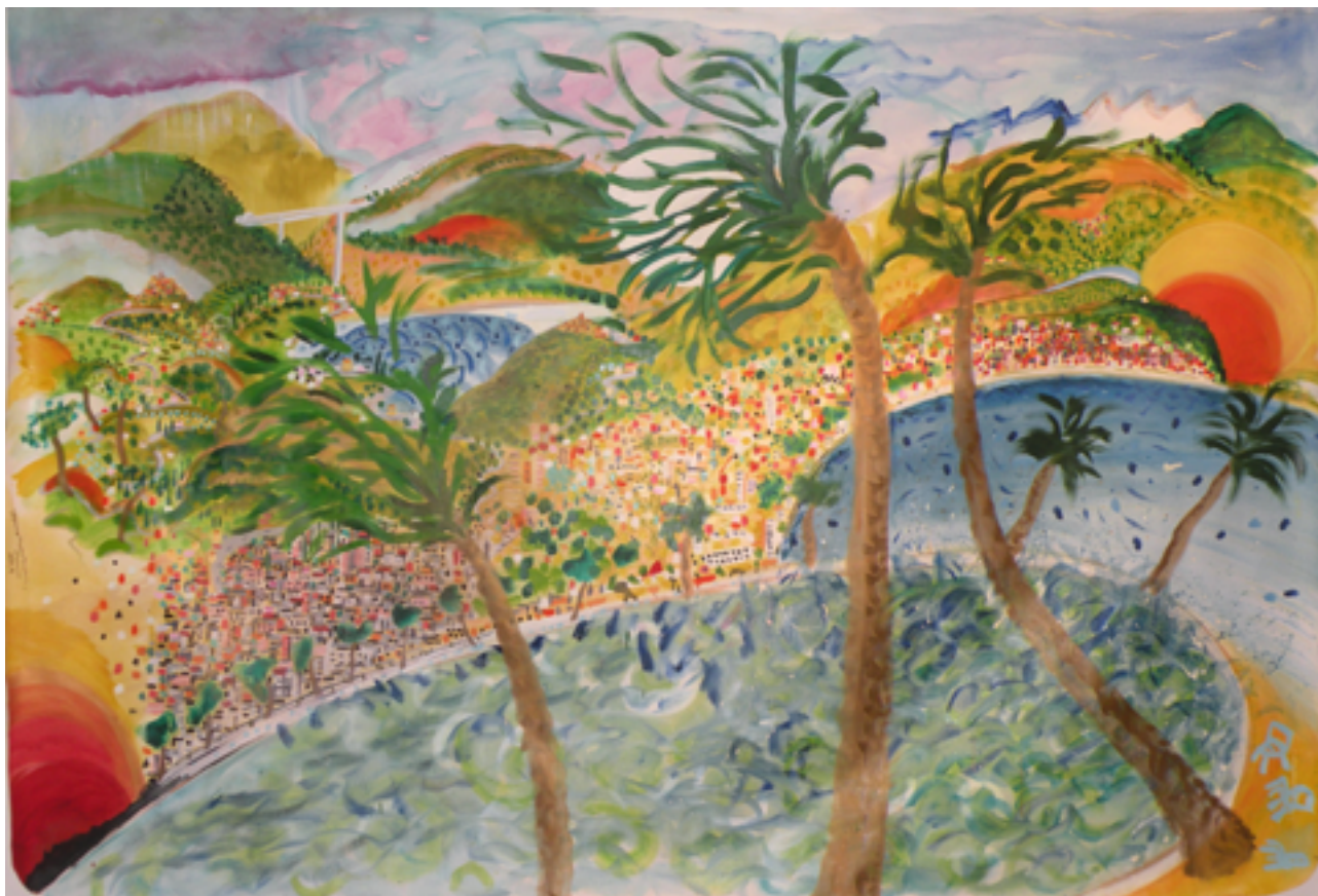
Jonathon BROWN (Ecosse), Tempête à Nice , 2010, Huile sur toile, 150 x 200 cm, Don de l'artiste en 2014