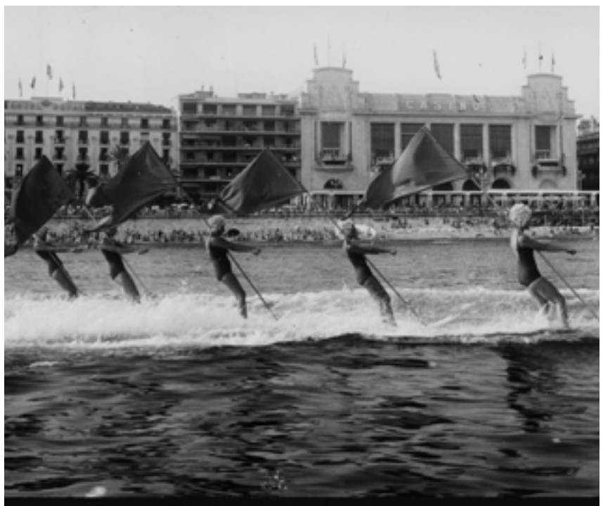
Les championnes du monde de ski nautique en démonstration sur la Côte d'Azur, 1967