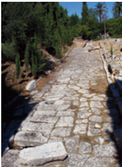
Decumanus (voie est-ouest) du site archéologique de site de Cimiez © MAN / Ville de Nice.

Cette exposition se propose d'évoquer l'évolution de ces voies de communication est-ouest, depuis l'époque romaine, jusqu'à la période contemporaine, par le biais de nombreuses collections, rassemblées pour l'occasion, ainsi que des documents d'archives mais également des créations contemporaines.