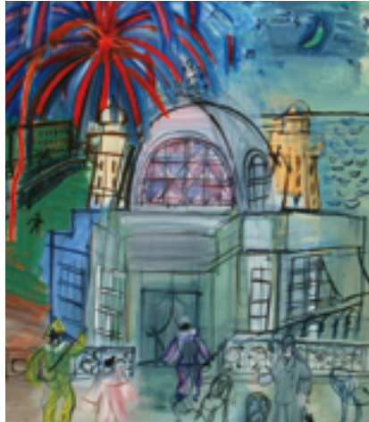
Raoul Dufy, Feu d'artifice à Nice, le casino de la jetée-promenade , 1947, peinture, huile sur toile, Musée des Beaux-arts Jules Chéret

au premier plan, Dufy répète surtout une même vue, où l'ensemble de la Baie s'arrondit sur la droite, tandis que s'étagent, horizontales et parallèles, d'abord la Promenade des Anglais