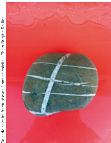
Galet de calcaire fracturé avec filons de calcite

La baie des Anges est baignée par une mer presque sans marée (marnage de 50 cm maximum) caractérisée par des vagues courtes. Les hauteurs moyennes et significatives de ces