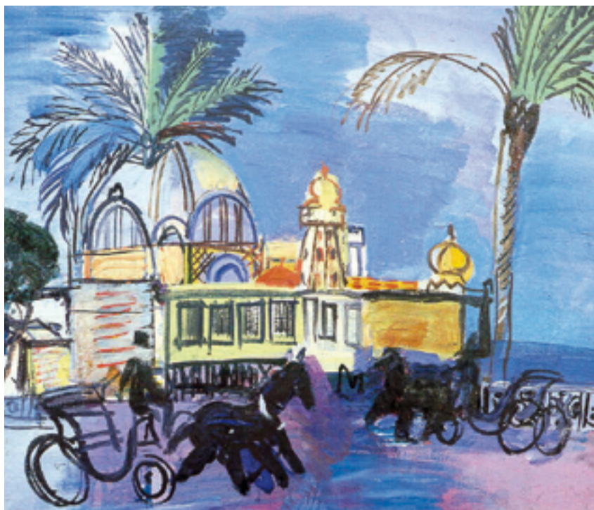
Raoul Dufy, Le casino de la jetée-promenade aux deux calèches à Nice , 1927, peinture, huile sur toile, Musée des Beaux-arts Jules Chéret