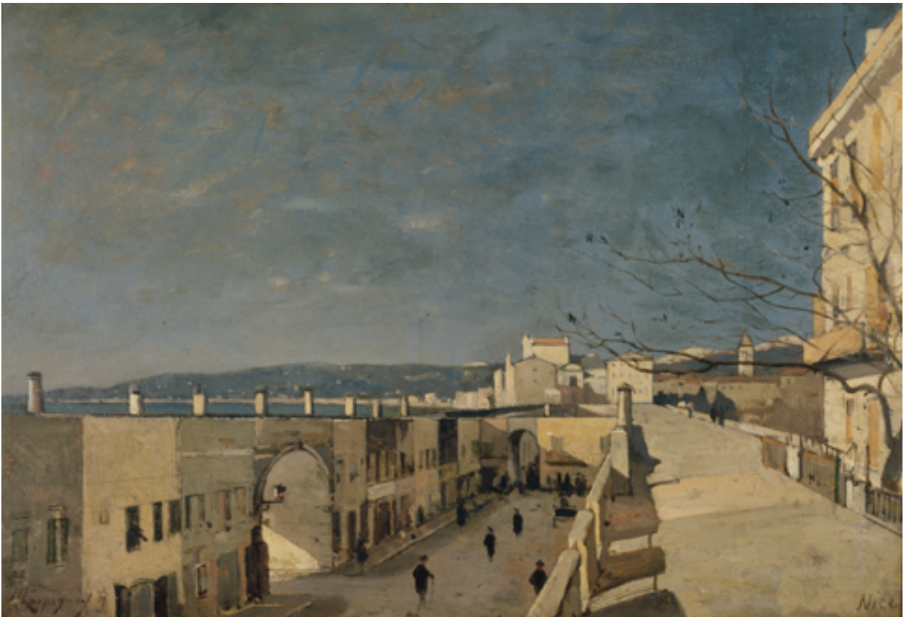
Henri Harpignies, Un quai à Nice, Les Ponchettes , 1887, Musée des Beaux-Arts de la Ville de Paris, Petit Palais

Commissaire général de « Nice 2015. Promenade(S) des Anglais » Président de la Mission pour l'inscription de la Promenade des Anglais sur la Liste du patrimoine mondial de l'UNESCO