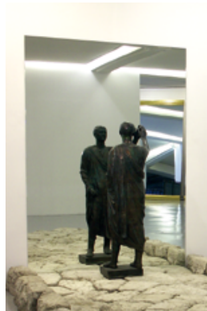
Michelangelo Pistoletto, L'Etrusque et la voie romaine, 1976-2007. Miroir, bronze, moulage en résine epoxy d'une partie du decumanus du site archéologique des thermes de Cimiez. (Cemeterium)

« Je veux que Nice n'ait jamais à se repentir de l'annexion ». Cette phrase de Napoléon III, en visite à Nice en septembre 1860, annonce les efforts consentis par la France en direction du nouveau territoire. Parmi eux, la liaison ferroviaire permettra le désenclavement de Nice vers l'Europe du Nord. La « station de Nice » est mise en service le 18 octobre 1864, par la Compagnie des chemins de fer de Paris à Lyon et à la Méditerranée (PLM), lorsqu'elle ouvre à l'exploitation la section entre Cagnes et Nice, terminus de la ligne depuis Toulon. L'arrivée du train jouera un rôle capital dans le développement du tourisme et facilitera grandement l'accès de nombreux voyageurs et hivernants vers la Côte d'Azur.