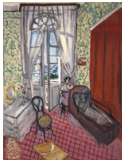
Henri Matisse Femmes au canapé ou Le Divan , [1921] Huile sur toile, 92 x 73 cm Musée de l'Orangerie, Paris © Succession H. Matisse