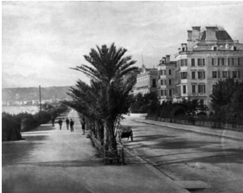
Eugène Degand, Promenade des Anglais, Nice, France