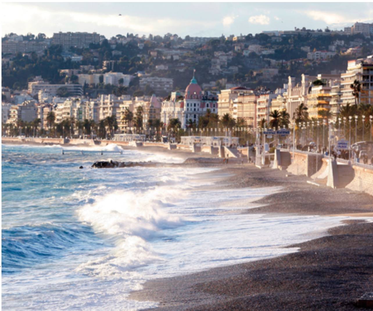
La Promenade des Anglais

La Ville de Nice remercie pour leur concours la compagnie de Phalsbourg et la FNAC.