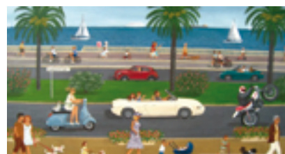
Claude Ulhmann-Cottet, La Promenade des Anglais , Huile sur toile, 2014, Collection de l'artiste

Le commissaire remercie la Villa Arson, la Collection de l'Art Brut de Lausanne, le LaM, La Fabuloserie, la Galerie Naudin, la Fondation Dina Vierny - Musée Maillol, ainsi que les collectionneurs privés et les artistes qui ont collaboré à la mise en œuvre de cette exposition.