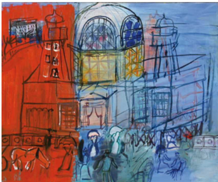
Raoul Dufy, Le casino de la jetée-promenade à Nice, 1950, peinture, huile sur toile, Musée des Beaux-arts Jules Chéret

Néanmoins, ce qui se dévoile dans ces travaux niçois, c'est aussi la genèse de l'œuvre de Dufy, sa capacité à mobiliser ses souvenirs de paysages, de couleurs, de lumière, de motifs afin de nourrir ses compositions, peintes, rappelons-le, après-coup en atelier comme en témoignent ses carnets de croquis emplies d'annotations de couleurs. Originaire du Havre, il recyclera sa vie durant des motifs marins, baigneuses, coquillages, vaguelettes, que l'on retrouve durant les années niçoises. Les fenêtres ouvertes, thème central de son œuvre, se déclinent également sur la Manche comme