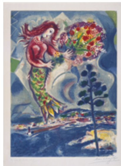
Sirène au pin , lithographie gravée par Charles Sorlier sous la direction de Marc Chagall 1967 Lithographie appartenant au portfolio Nice et la Côte d'Azur Collection particulière © ADAGP, Paris 2015

Commissaires : Anne Dopffer et Sarah Ligner