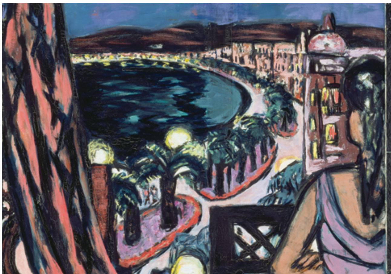
Max Beckmann, Promenade des Anglais in Nice , 1947, Essen, Museum Folkwang

Le commissaire remercie tous les responsables des institutions municipales, départementales et nationales qui ont éclairé ses choix de leurs recommandations et conseils.