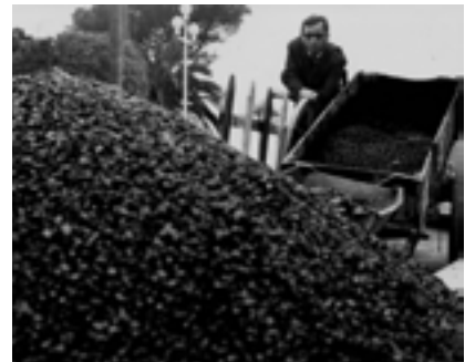
Bernar Venet (Château-Arnoux, 1941), photographie de Bernar Venet devant un tas de charbon mélangé avec du goudron, jardin Albert 1 er , Nice, 1963