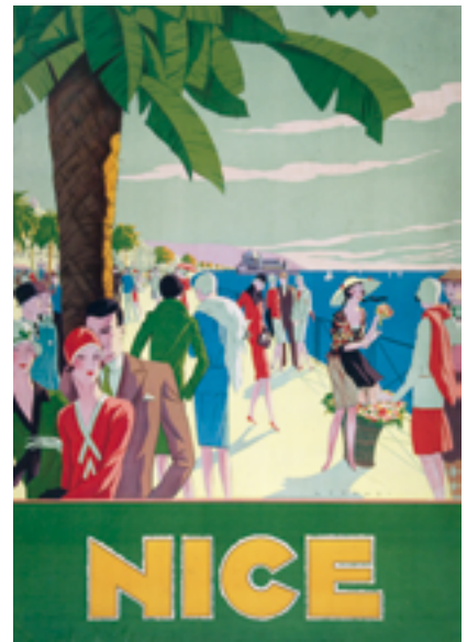
Affiche illustrée par Lorenzi, 1926, imprimerie de l'Éclairneur à Nice

a également été le cadre d'une vie artistique et littéraire intense, liée au séjour de nombreux artistes et écrivains. L'intensité de la vie mondaine, avide de loisirs « cultivés », suscitera notamment une vie musicale de grande qualité.