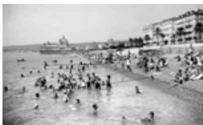
La plage, les baigneurs ca 1930, Nice, France Photographie N&B Tirage argentique sur papier albuminé 12x25,2 cm - Cliché Jean Gilletta Théâtre de la Photographie et de l'Image Charles Nègre

Cette fresque historique parcourue, le visiteur sera invité à une autre approche de la même réalité en traversant un vaste panoramique de la partie du front de mer niçois s'étendant de Rauba Capeu à l'aéroport et incluant les actuels quai Rauba Capeu, quai des Etats-Unis et Promenade des Anglais. Ce panoramique réalisé par le photographe Olivier Monge décrira ainsi la façade sur mer de la Ville d'hiver avec sa promenade terrasse des Ponchettes et sa célèbre Promenade des Anglais qui, à partir de son esquisse au début du XIX e , s'est progressivement étendue vers l'Est jusqu'à la vieille ville et vers l'Ouest pratiquement jusqu'au lit du Var. Cet « état des lieux » permettra d'évoquer les états antérieurs des parcelles occupées par les immeubles actuels, les architectes et décorateurs qui les ont conçus, les personnalités qui y ont vécu et certains des événements qui s'y sont déroulés. Certains de ces immeubles renverront également vers des réalités architecturales de la Ville d'hiver toute entière. C'est ainsi que l'hôtel Ruhl, l'hôtel Royal, le Palais de la Méditerranée tous trois construits par les architectes Dalmas père et