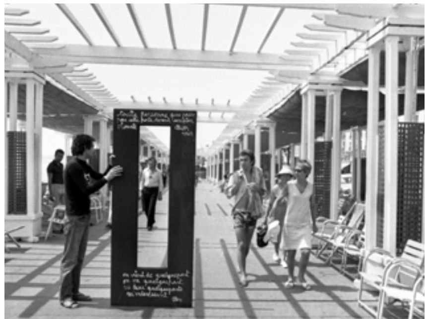
Ben (Naples, 1936), photographie de la performance Je signe la vie , Promenade des Anglais, Nice, circa 1972